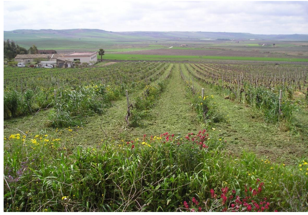
Foto 1 - vigneto con inerbimento