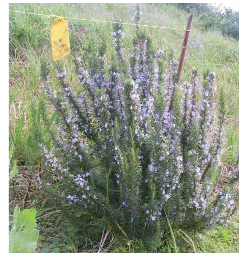
Foto 9 - Trappola gialla per cicaline su rosmarino