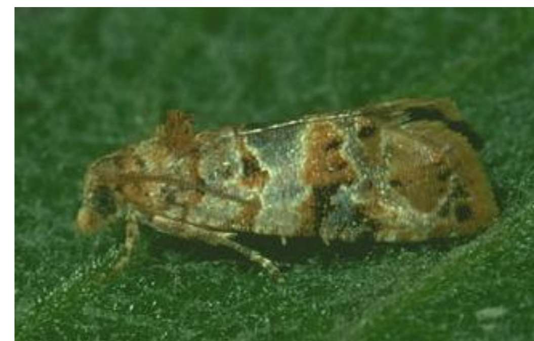
Foto 5 - Lobesia botrana D. & S.