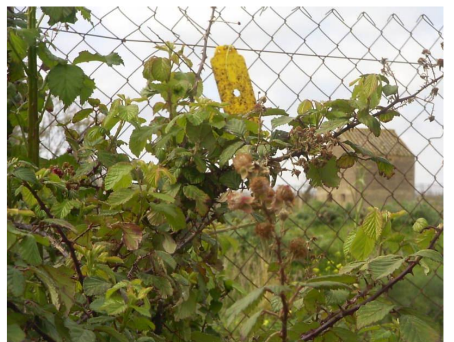
Foto 8 - Trappola gialla per cicaline su Rosa canina