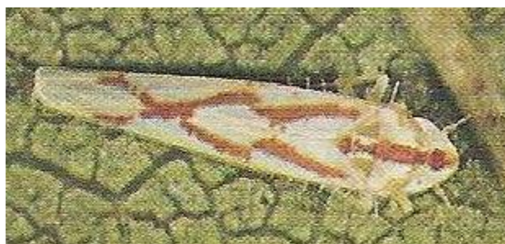
Foto 4 - Zygina rhamni Ferrari