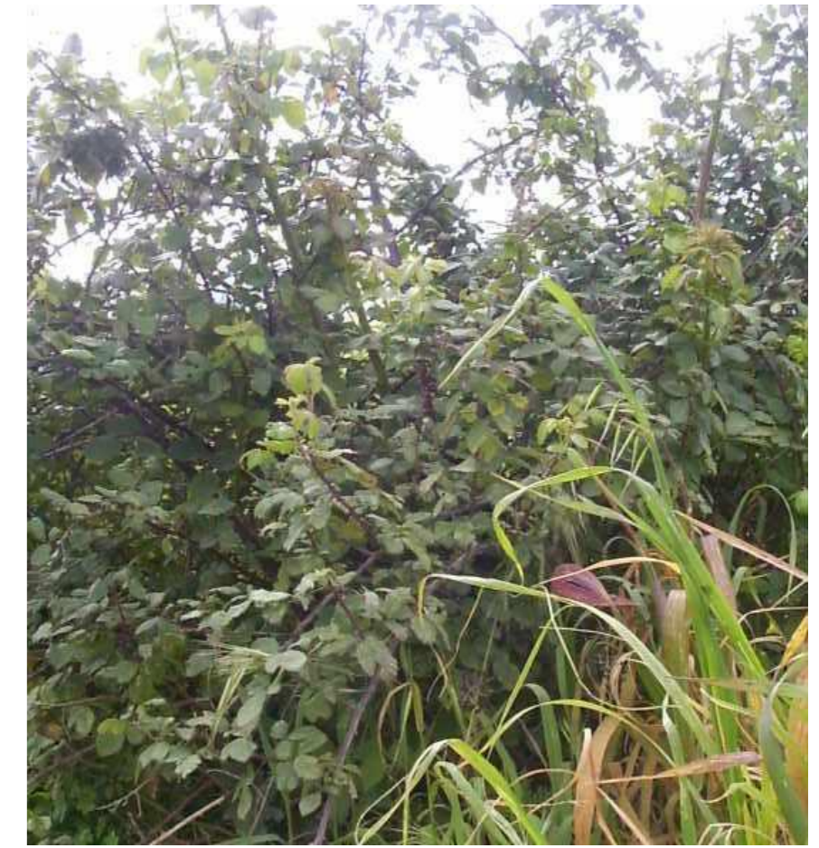
Foto 6 - Rubus spp.