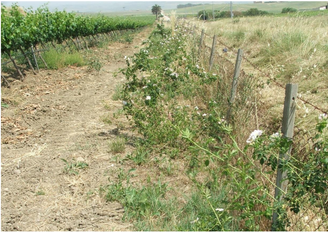
Foto 2 - Vigneto con siepe di Rosa canina L.