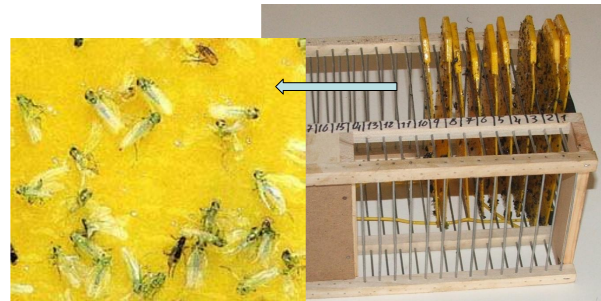
Foto 11 - Trappole in laboratorio