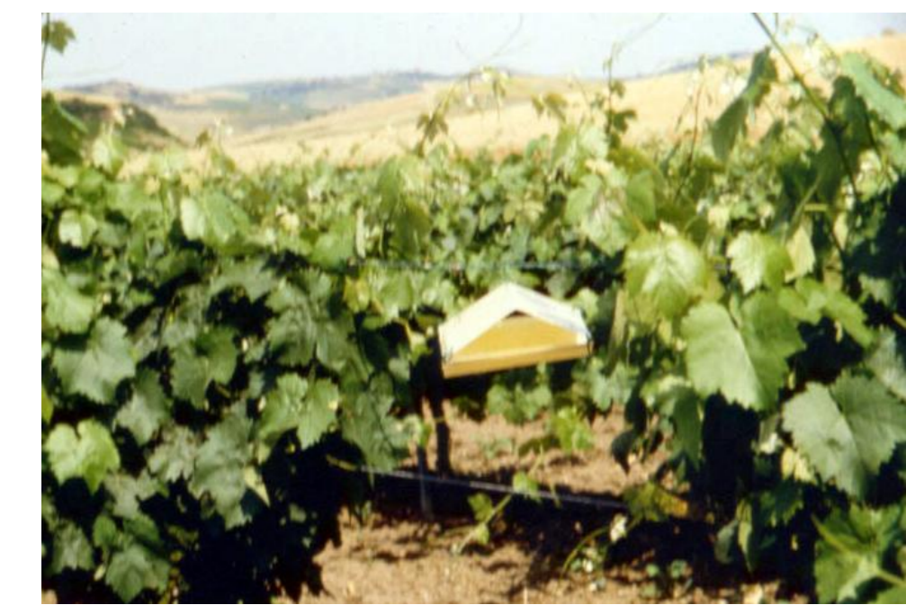
Foto 10 - Trappola per Lobesia botrana

Rubus spp. e R. canina , in primavera sfarfalla e depone nelle uova delle cicaline della vite.