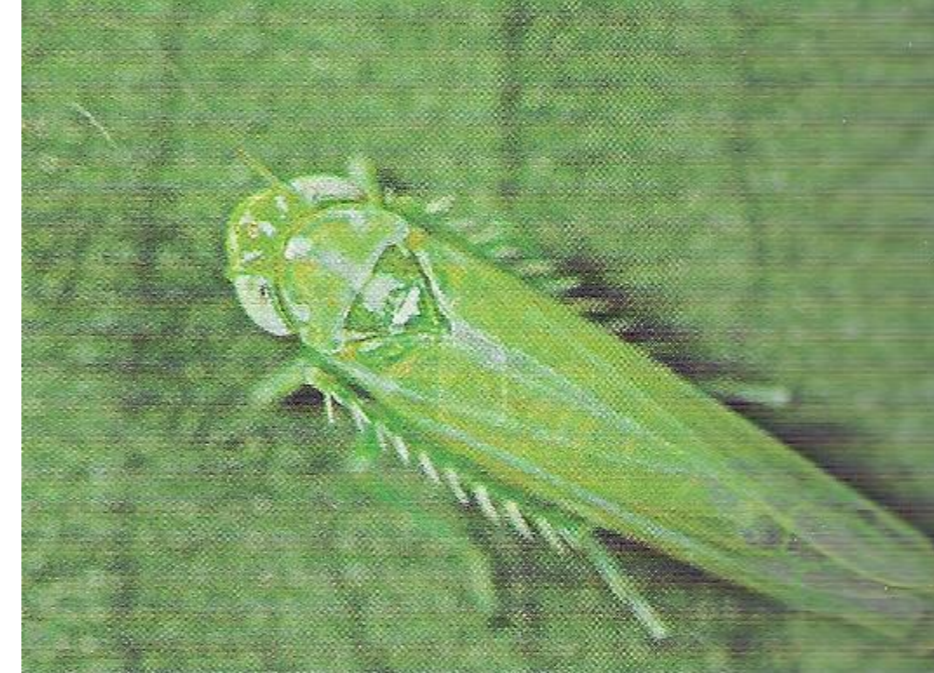
Foto 3 - Jacobiasca lybica B. & Z.

Anagrus atomus (Foto 7) è un ooparassitoide che sverna come uovo nelle uova di cicaline su